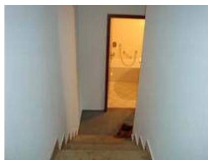
Morgenstraße Flur (2)