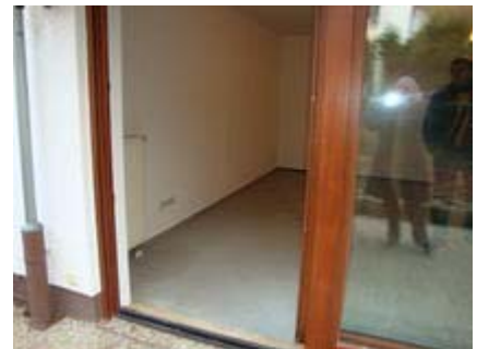
Morgenstraße Blick von Terrass