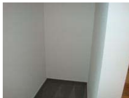
Morgenstraße Flur (3)